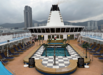
■夏には縁日なども開催されました