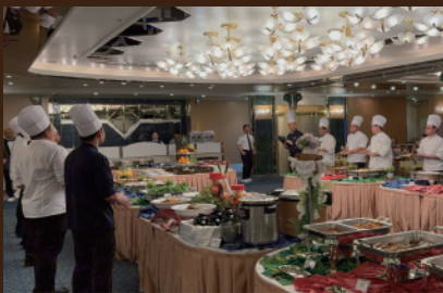
■PV で働いていたクルーも複数名！