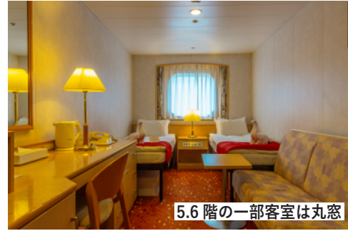
5.6階の一部客室は丸窓