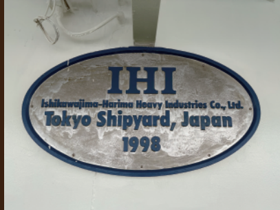
■今なお残る建造を記したプレート