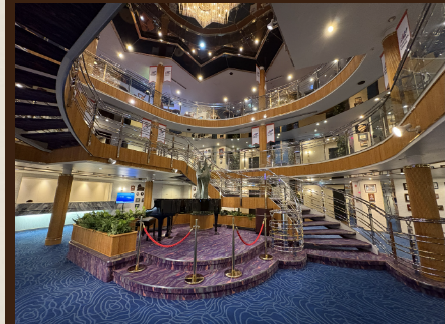
■船内に一歩足を踏み入れば懐かしいエントランスがお待ちしております