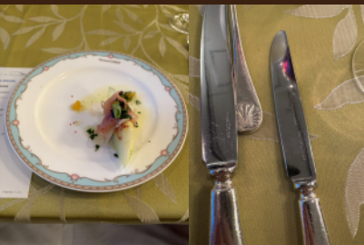
■よく見ると食器に刻印があります！