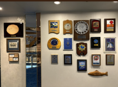
■寄港記念の盾は今も飾られています