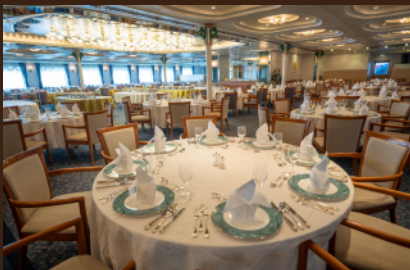
■メインダイニングもほぼそのまま！