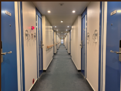
■お部屋への道のりは覚えていますが