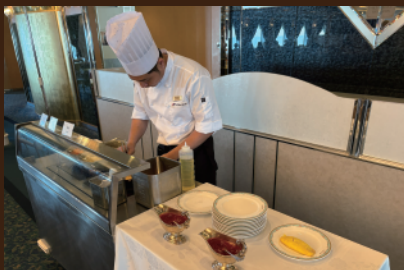
■目の前で調理されるオムレツも！