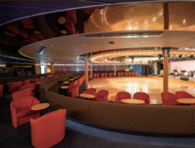
■ダンス教室などで盛り上がりました